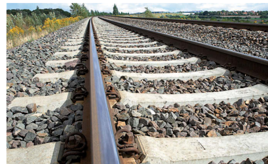
Gleis ohne Schienenverwerfungen Rails without buckles